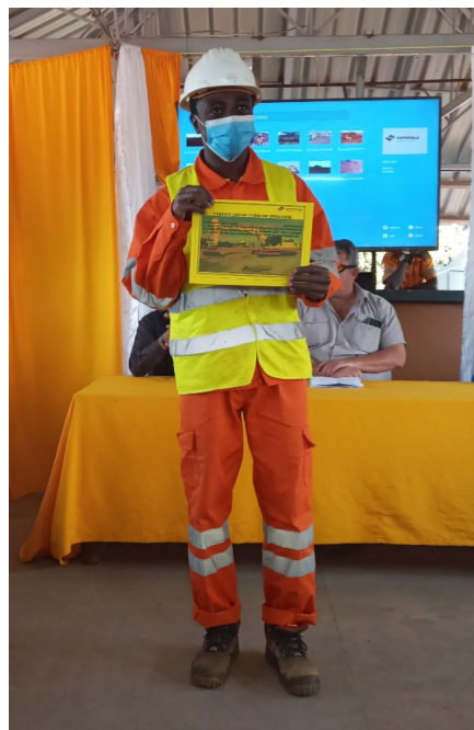
Participante exhibe com satisfação o certificado ganho com muito esforço e dedicação.

Com o engajamento de todos na criação de condições aos recém-formados para adquirirem conhecimentos necessários, darem o seu contributo e continuidade do trabalho da empresa, os jovens apro-