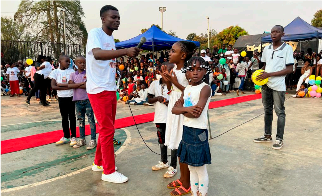
FOTO REPORTAGEM DA FESTA DAS CRIANÇAS